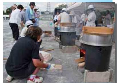
総合防災訓練の様子