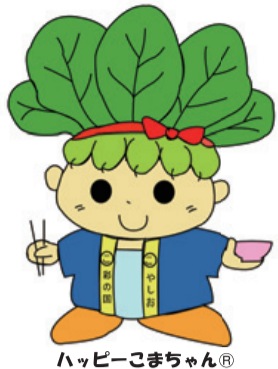
ハッピーごまちゃん®