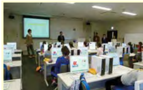
パソコンを使っでの経営シミュレーション

感想 ▼パソコンを使ったゲームを通して屋台の経営をしました。利益を黒字にすることは大変でしたが、友達からアドバイスが聞けたので良かったです。 ▼屋台を運営しようでは、赤字ばかりでした。経営をしていくためには、情報をうまく活用することが大