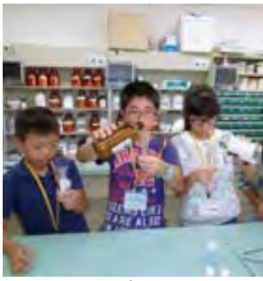
シロップ薬の調合

感想 ▼シロップ薬を入れるときにこぼれそうになり難しかったです。学生の方から、薬学部に入學するまでのことや研究のことを教えていただきました。私は、大工さんになりたいので、自分ができる研究があれば自分から進んでやっていきたいと思いました。 ▼薬を調合する際は、混ぜる量や順番など決まりがあることを学びました。興味があるので薬学部に入りたいと思いました。知りたいことを本などで調べていきたいです。