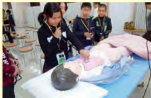
聴診器を使って心臓や肺の動きを聞く

感想 ▼心臓や肺の音を聞きませんでした。健康なときとそうでないときの音が違うことが分かりました。▼聴診器で何をしているのかが分かりました。また、人の役に立つということとがうれしいことだと思いました。 ▼やさしく接することで、患者さんが安心することが分かりました。▼看護師の大変さや大切さが分かりました。おばあさんが看護師なので、話を聞きたいと思いました。