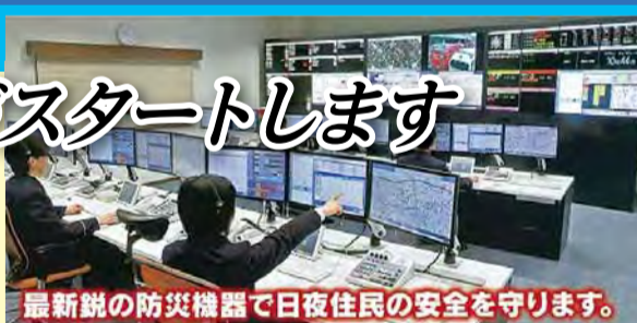
最新鋭の防災機器で日夜住民の安全を守ります。

市民の皆さんの安全・安心な暮らしを守るため、八潮市と草加市の消防業務を共同で行うこととなります。消防の広域化によるメリットや各種届け出の窓口についてお知らせします。問 消防本部総務課 ☎996-0119