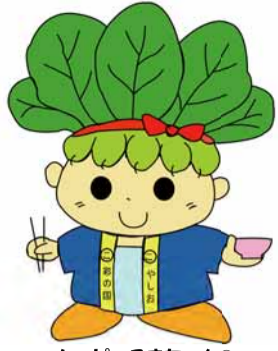
ハッピーごまちゃん®