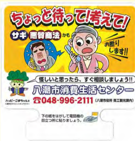
消費者啓発用電話機カード