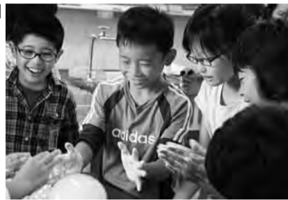
特別授業「身近なものでおもしろ実験」の様子

した。普段体験できない学習に取り組んでいました。 ③ 入試対策教室 市内中学校の先生を講師に招き、埼玉県公立高校入試問題の対策授業を行いました。これまでの学習の成果を確認しながら、先生のアドバイスを熱心に耳を傾けていました。平成28年度のジョイスタは、5月から開催予定です。申込用紙は各小・中学校を通して、対象の児童・生徒全員に配布します。