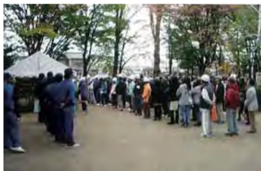
若柳町会「自主防災訓練」

地域の夏祭りや日帰り旅行、グラウンドゴルフ大会など、誰もが楽しめる事業をとおり、地域のふれあいの場と絆づくりを進めています。