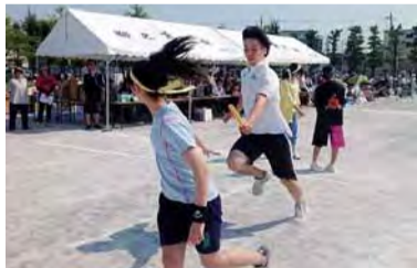
柳之宮町会「運動会」

障がいのある方や高齢の方、子どもたちの見守り活動など、誰もが地域でいきいきと健やかに暮らせるような活動を行っています。