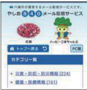
スマートフォン版トップページ