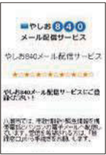
携帯電話版トップページ