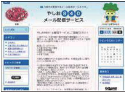
パソコン版トップページ