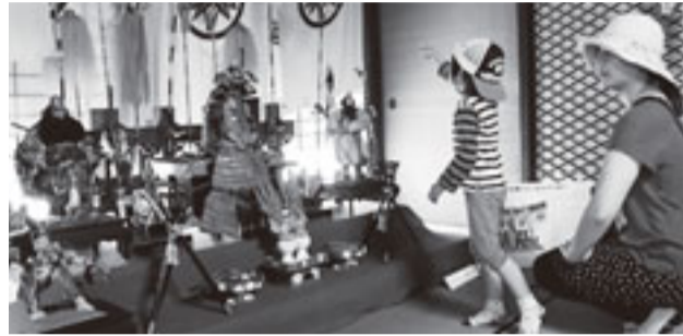
奥座敷に飾られる節句人形

4月16日から5月8日までは、季節展示「端午の節句」を開催します。古民家の奥座敷いっぱいには、いにしへの勇猛果敢な武将の姿を彷彿とさせる節句人形(昭和13年製)が飾られます。節句行事の起源や、昭和53年から3年にわたって市域を大字単位で調査した「八潮の民俗資料」をもとに、地域で行われてきた節句供