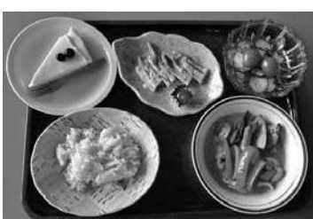
昨年実施した際のメニュー

※受診できる回数は年度内1回 園八潮市国民健康保険被保険者(補助金申請書提出) ※喀たん検査を除く