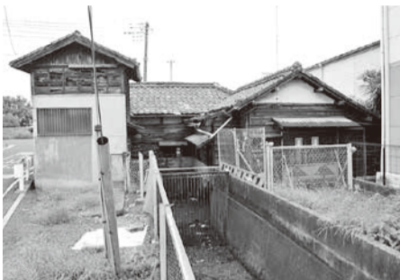
旧用水路・建屋 (西側)

また、中川からの流入路は、安全のために埋め立てられ、現堤防下の樋管は、河川法の占用許可条件上、「目的を終えた後はすみやかに撤去し、堤防を原形に復旧すること」とされ、文化財的価値も評価されていることから、樋管内部を充填して残すことができないか、国土交通省と協議を重ねています。