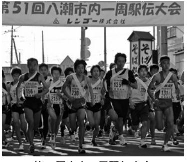
第51回市内一周駅伝大会