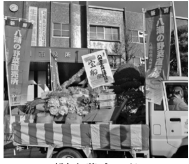
新年初荷パレード