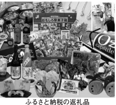
ふるさと納税の返礼品