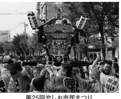
第25回やしお市民まつり