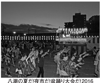
八潮の夏だ! 夜市だ! 盆踊り大会だ! 2016