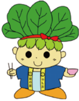
ハッピーごまちゃん®