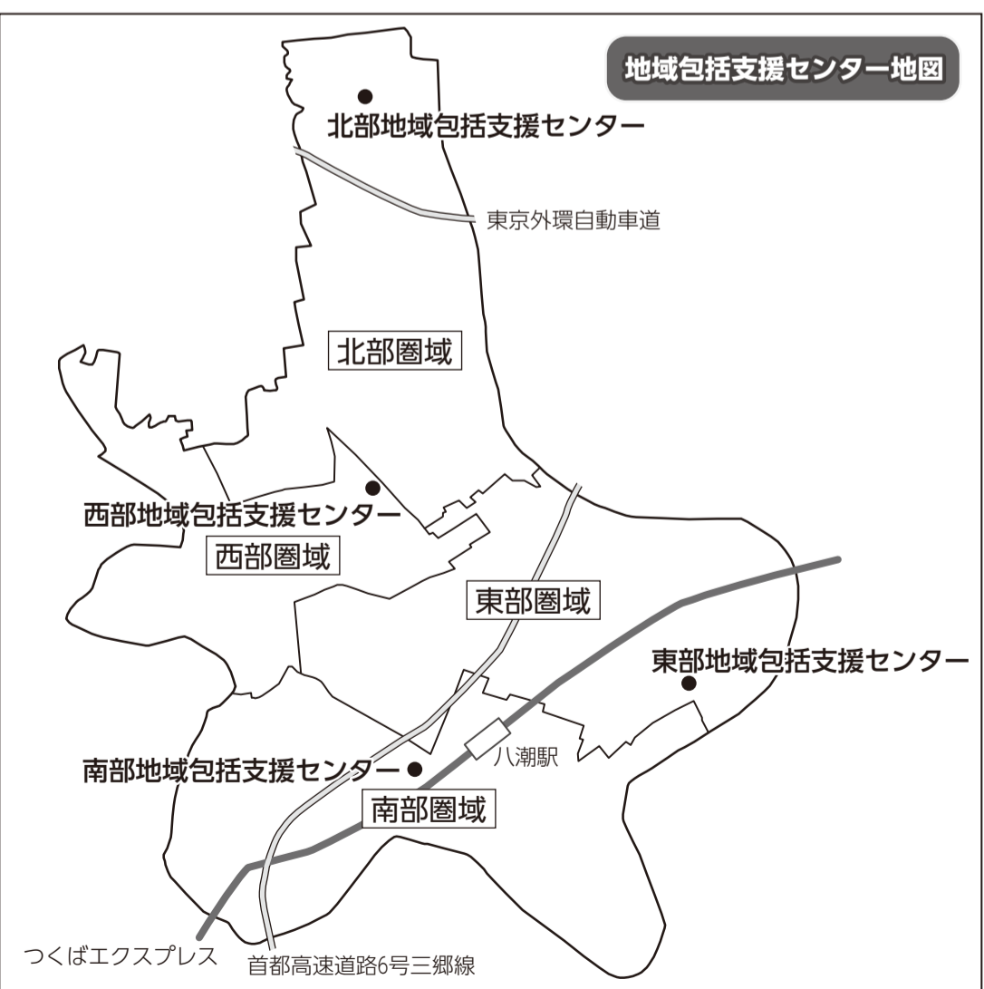
別表 地域包括支援センター