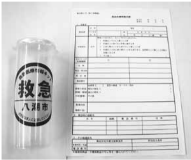
救急医療情報キット

救急医療情報キットに入れた医療情報を参考に、救急隊員が適切な対応を行います。対健康に不安があり、次のいずれかに該当する方 65歳以上で一人暮らしの方 65歳以上の方のみの世帯に属する方 心身に障がいのある方で一人暮らしの方 65歳以上または心身に障がいのある方で、長時間一人暮らしと同様の状態となる方 費無料