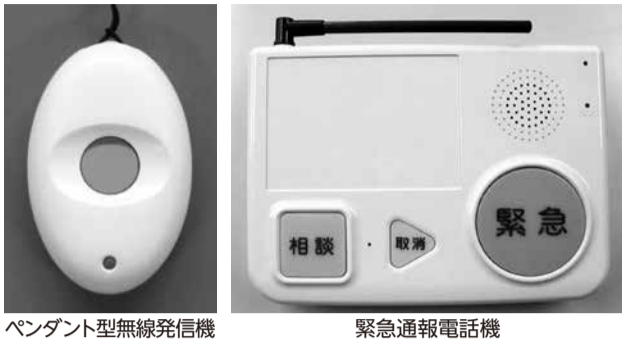
ペンダント型無線発信機

緊急通報端末機器（緊急通報電話機、ペンダント型無線発信機）を貸与します。急病などで緊急時にボタンを押すと、受付センターから消防署に通報が入り、迅速な救急活動を行います。