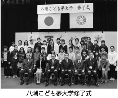
八潮子ども夢大学修了式