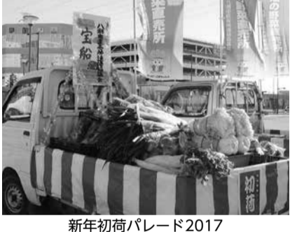
新年初荷パレード2017

▼1月11日、八潮メセナで、「第42回八潮市農業祭」に出展した優秀な農産物などの生産者を表彰