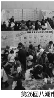
第26回八潮市消費生活展

▼2月23日から26日までの間、やしお生涯学習館で、「第26回八潮市消費生活展」を開催