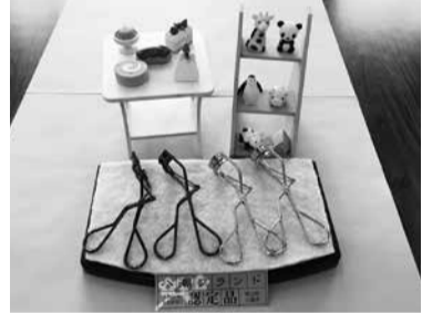
八潮ブランドに認定された「アイラッシュカーラー」(手前)と「おもしろ消しゴム」(奥)

▼2月21日、市内で製造された優れた2製品を八潮ブランド品として認定し、認定式を開催