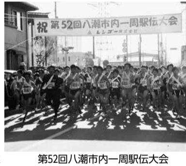
第52回八潮市内一周駅伝大会

▼1月20日、老人福祉センター寿楽荘で、「平成28年度寿大学校」の卒業式が行われ、31人が卒業