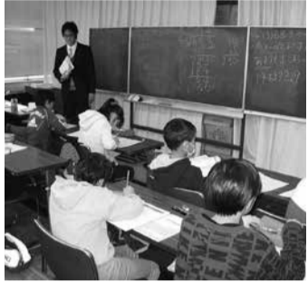
学習塾との連携事業

▼1月25日から2月22日までの間、八幡公民館で、「シニア向けスマートフォン教室」などの4講座を、1月22日から2月10日までの間、八幡公民館で、「ファイナンシャル・プランナーによる親子金銭教育」などの3講座を開催