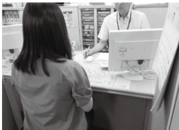
専門の相談員に個別相談