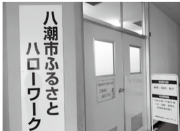
八潮市ふるさとハローワークの入口(ゆまにて2階)