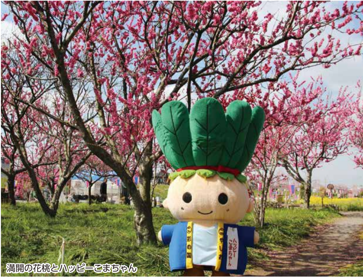
満開の花桃とハッピーこまちゃん

3月16日から31日まで中川やしおフラワーパークで「花桃まつり」が開催されました。 24日・25日に行われた特別イベントでは、花桃ウォーキングや、ステージイベント、手ぶらでバーベキューなどが行われるとともに、水辺の楽校では、カーン体験や防災まつりなどが行われ、2日間で両イベント合計2万7300人の方が来場されました。