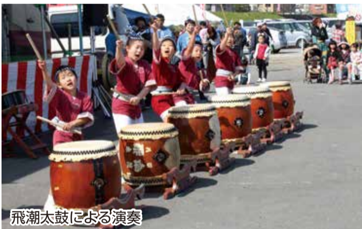
飛潮太鼓による演奏