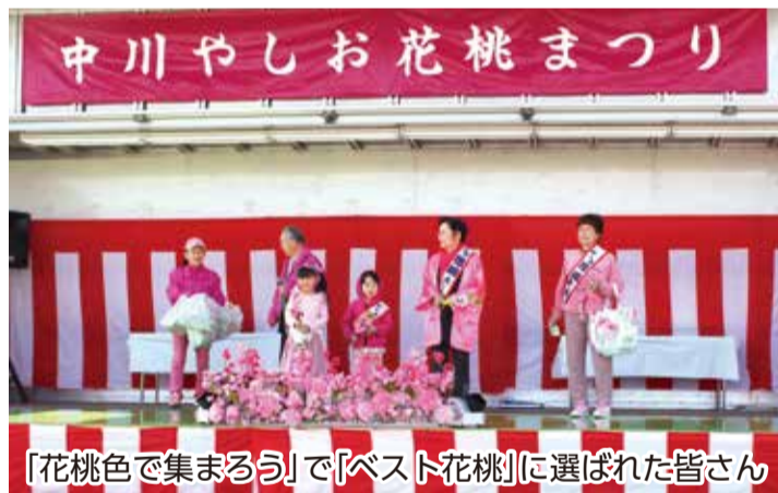
「花桃色で集まるう」で「ベスト花桃」に選ばれた皆さん