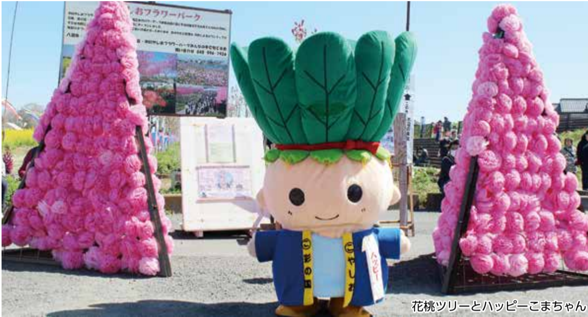
花桃ツリーとハッピーこまちゃん