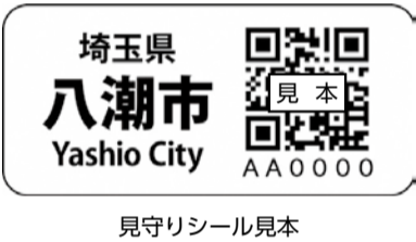
見守りシール見本