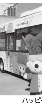
ハッピーこまちゃん号

▼1月7日、軽トラックに八潮産農産物を載せての「新年初荷パレード2019」を開催