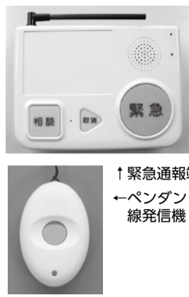
↑緊急通報端末機 ←ペンダント型無線発信機

緊急通報端末機およびペンダント型無線発信機を貸与します。急病などで緊急時にボタンを押すと、受付センターから消防署に通報が入り、迅速な救急活動を行います。