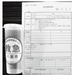
救急医療情報キット