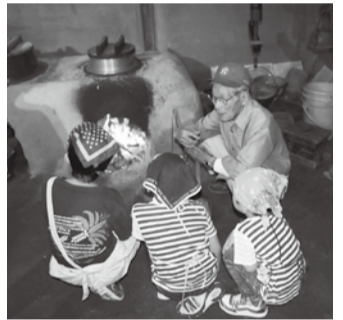
カマドでご飯をたく様子

【10月26日(土) 午前10時～正午】 場資料館古民家 対小学生以上 【11月9日(土) 午前9時30分～午後3時】 場やしお生涯学習館