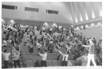
昨年行われたイベントの様子