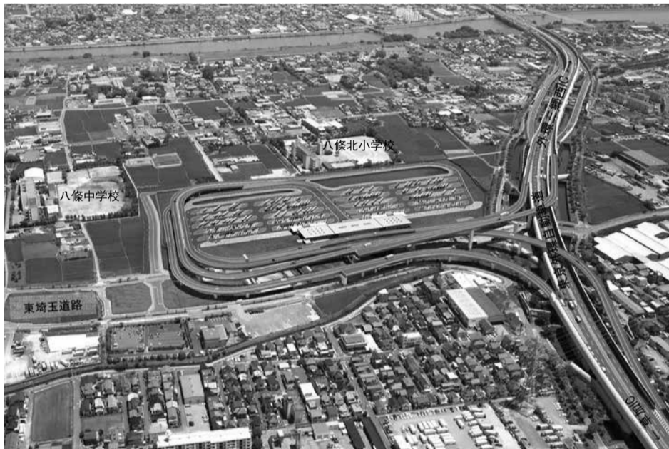
※現時点でのイメージであり、実際と異なる場合があります。