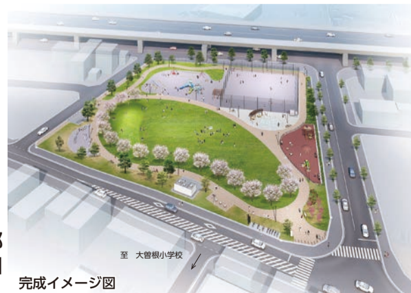
(仮称)八潮南部 西地区近隣公園 (令和5年4月開園予定)