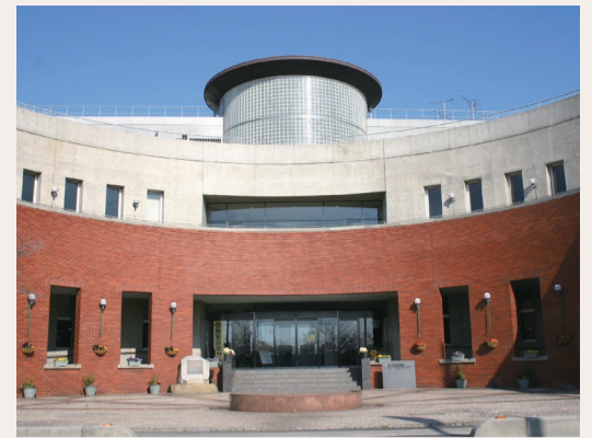
やしお生涯学習館オープン