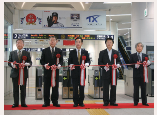
つくばエクスプレス八潮駅開業