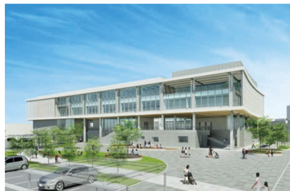
市庁舎建て替え (令和6年1月開庁予定)