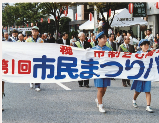
第1回市民まつり開催