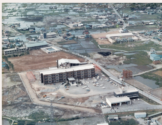
市制施行当時の市役所