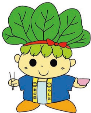
ハッピーこまちゃん®