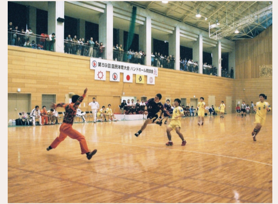
第59回国民体育大会彩の国まごころ国体開催