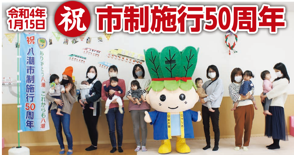
やしお子育てほっとステーション利用者の皆さん