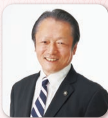
八潮市長 大山 忍

結びに、新型コロナウイルス感染症の早期終息を願うとともに、皆様のご健勝とご多幸を心からお祈り申し上げまして、新年のあいさつとさせていただきます。