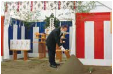
新庁舎建設工事起工式