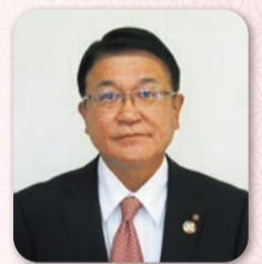
八潮市議会議長 寺原 一行

結びにあたり、本年も格別のご支援とご協力を賜りますようお願い申し上げますとともに、皆様のご健勝とご多幸を心からご祈念申し上げます、新年のごあいさつとさせていただきます。