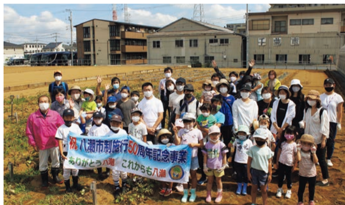
50周年記念冠事業「じゃがいも栽培を親子で農業体験」参加者の皆さん

八潮市は、昭和47年1月15日に市制を施行し、令和4年1月15日に50周年を迎えます。