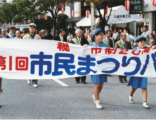
第1回市民まつり開催