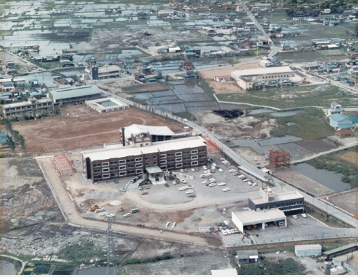
市制施行当時の市役所