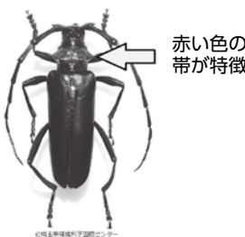
赤い色の帯が特徴

成虫は全体に光沢のある黒色で、首回り(前胸背板)の赤色が特徴です。6月から8月上旬に現れ、樹皮の割れ目に産卵し、繁殖力が旺盛です。幼虫の期間は2年から3年。春から秋に樹木を摂食し、範囲は心材にまでおよび樹皮が枯