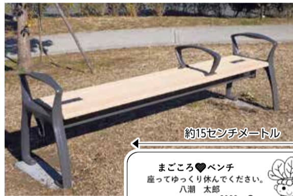
◀昨年設置した「まごころ♡ベンチ」(大瀬北公園)