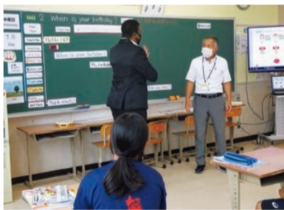
外国語授業の様子

八條北小学校では、「外国語教育の充実」「小中一貫教育・交流学習の充実」「体験学習の充実」を図り、少人数ならではのきめ細かな指導や特色ある教育活動を展開する小規模特認校制度を実施しています。