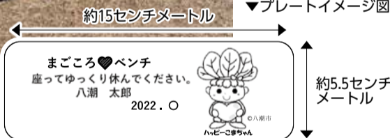
▼プレートイメージ図