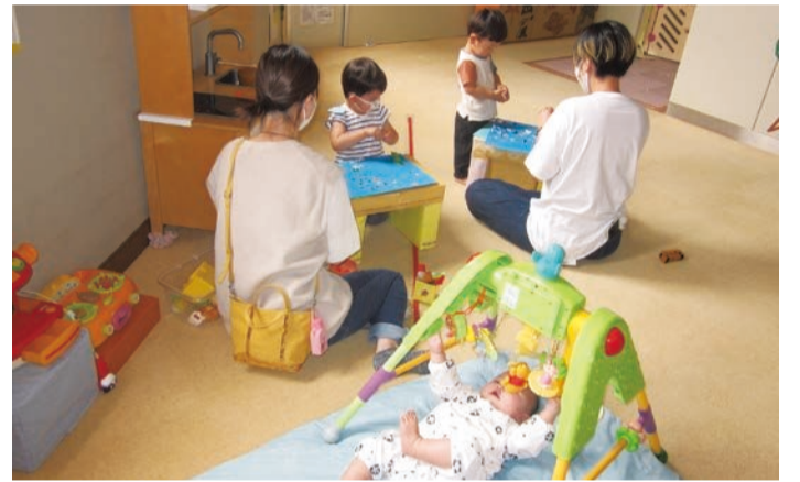
楽習館子育てひろば