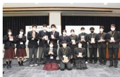
ビブリオバトルの参加者