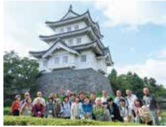
行田市(忍城前)での学外研修の様子

また、講師は各専門分野でご活躍の大学教授、市民大学の卒業生や市職員などさまざまです。