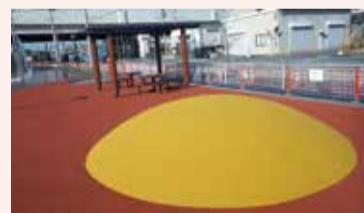
ゴムチップマウンド