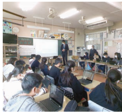
小坂町との相互派遣研修時の学校視察 問小中一貫教育推進室 ☎☎398

今後も、報告内容を市内各校で実践し、すべての児童生徒に「学力・体力の向上と豊かな心の育成」を推進していきます。