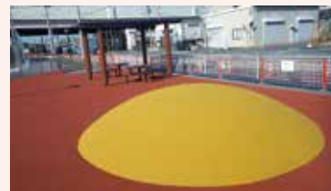
ゴムチップマウンド