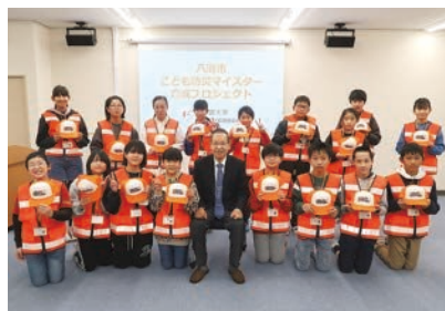
八潮子ども防災マイスター育成プロジェクト 問指導課☎9859

今年度の八潮子ども防災マイスター育成プロジェクトについては、7月から9月頃の実施を予定しています。