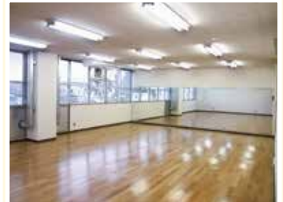
多目的室 (旧調理室)

※7月1日から利用条件および利用料金が変わります。詳細については、市ホームページをご覧ください。