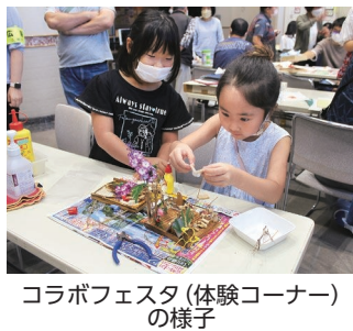
コラボフェスタ(体験コーナー)の様子