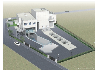
古新田ポンプ場増築イメージ