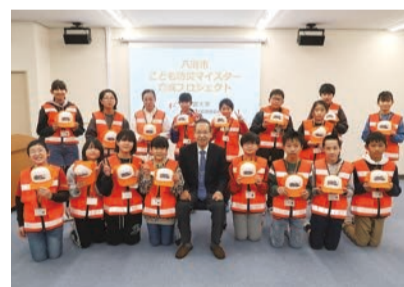
八潮子ども防災マイスター育成プロジェクト 問指導課☎9859

今年度の八潮子ども防災マイスター育成プロジェクトについては、7月から9月頃の実施を予定しています。