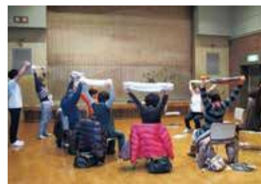
健康ストレッチ体験講座