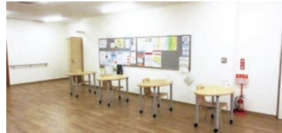
公民館フリースペース