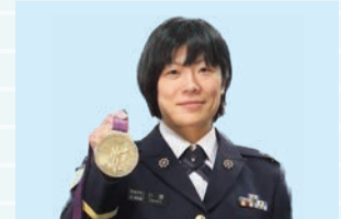
小原 日登美さん (レスリングオリンピック金メダリスト)

広報やしおに掲載したイベントなどについては、中止・変更になる場合があります。詳しくは、市ホームページをご覧ください。