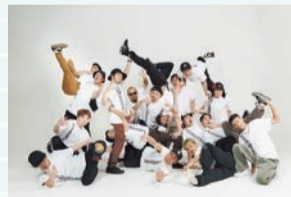
FOUND NATION (プロブレイクダンスチーム)