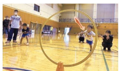
エアロケット投げ