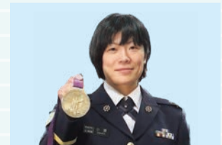
小原 日登美さん (レスリングオリンピック金メダリスト)

広報やしおに掲載したイベントなどについては、中止・変更になる場合があります。詳しくは、市ホームページをご覧ください。