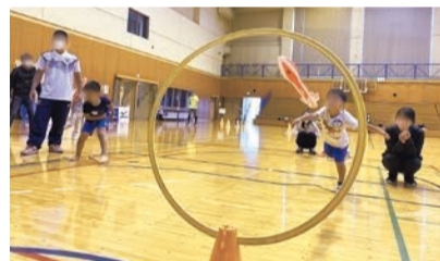
エアロケット投げ

日10月28日(土) 1部＝午前10時～11時30分、2部＝午後1時～2時30分、3部＝午後3時～4時30分 場エイトアリーナ 対1部＝市内在住・在園の年中・年長とその保護者、2部＝市内在住・在学の小学校1～3年生、3部＝市内在住・在学の小学校4～6年生 定1部＝15組、2・3部＝各30人(申込順) 費各部1,000円