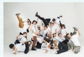
FOUND NATION (プロブレイクダンスチーム)