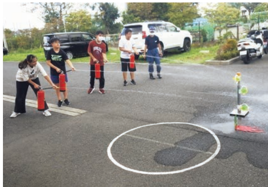
▲水消火器取り扱い