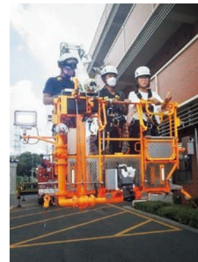
▲はしご車同乗体験