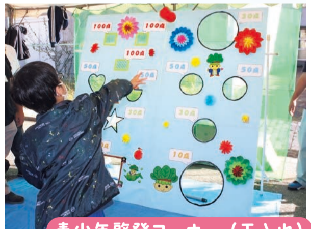
青少年啓発コーナー(玉入れ)