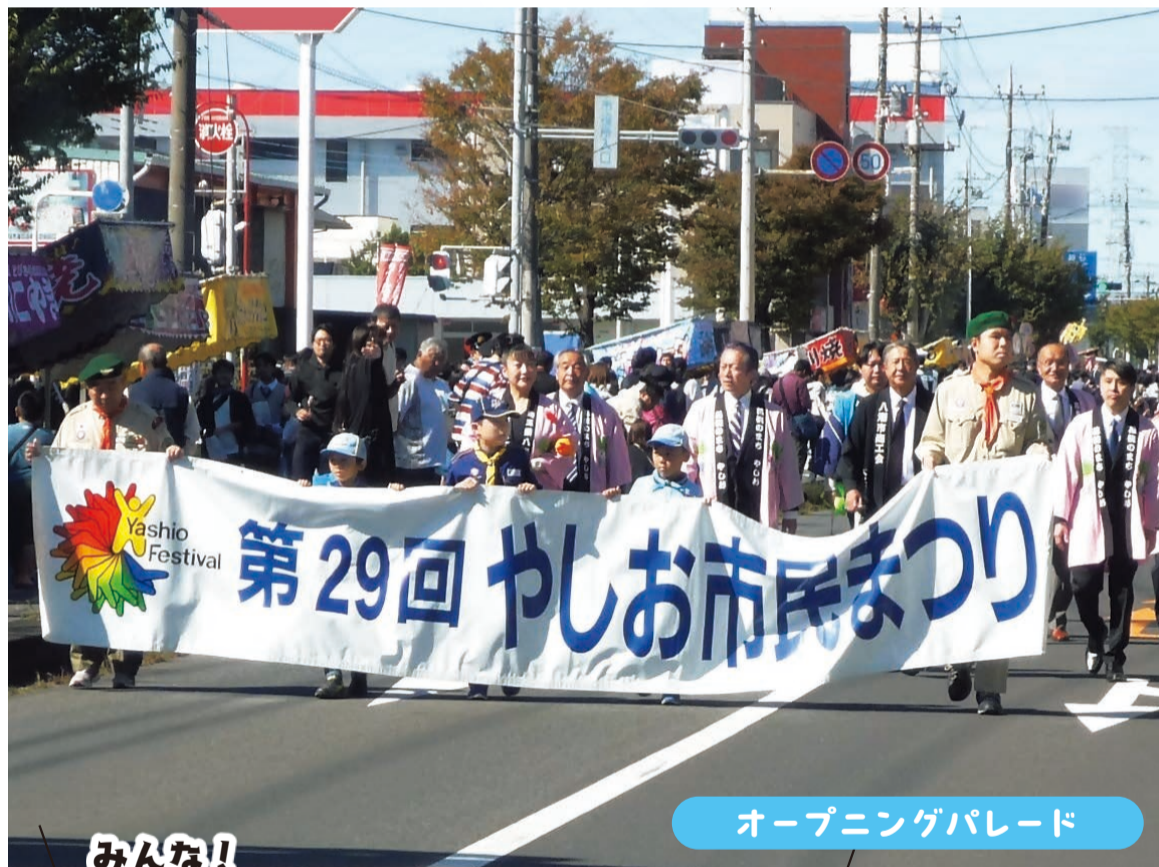
オープニングパレード