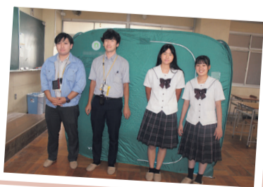
ワンタッチ式パーティション

たくさんの備蓄品を見て、少し安心しました。しかし、災害時には多くの人々が避難してくると思うので、自分で備えることが一番大切だと思いました。