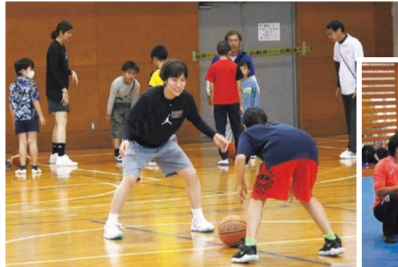
▲元プロバスケットボール選手によるバスケットボール教室