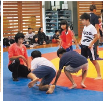
▲オリンピックレスリング金メダリストによるレスリング教室