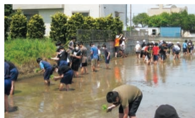
小学生と中学生で田植え体験

今回の研究発表会の成果は、令和6年2月に開催予定の「八潮の教育合同報告会2023」でも発表します。