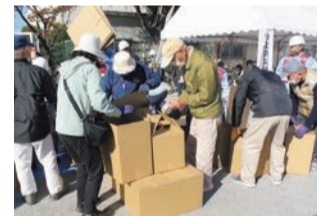
八潮市総合防災訓練の簡易ベッド・トイレ設置訓練

自主防災組織は「自分たちの地域は自分たちで守る」という自覚、連帯感に基づき、災害発生時の被害軽減を目的とした防災活動に取り組んでいます。