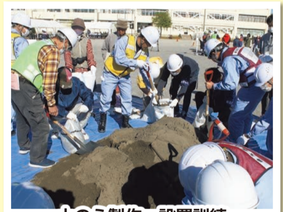
土のう製作・設置訓練