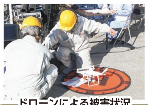
ドローンによる被害状況の動画撮影訓練