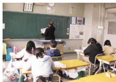
昨年度の8ゼミの様子

今年度も、3学期の平日の放課後に各小学校で開催する予定です。習熟度別の少人数クラスで、既習内容の復習から応用問題まで、幅広く問題を解くことで学力の向上を目指します。12月22日まで参加者の募集をしています。ぜひご参加ください。