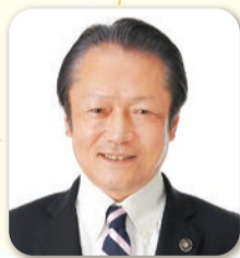
八潮市長 大山 忍

本年がより実り多き年でありますとともに皆様のご健勝とご多幸を心からお祈り申し上げます。新年のあいさつとさせていただきます。