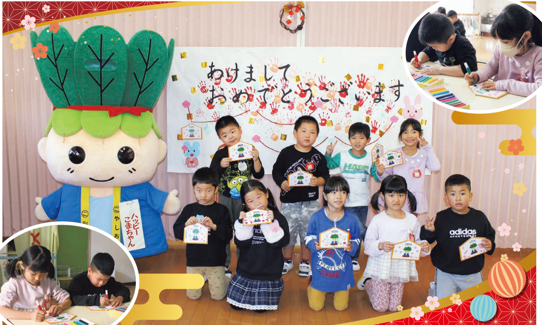
手作りの絵馬を持った伊草保育所の皆さん

●今月の主な内容● 2面：第59回八潮市内一周駅伝大会／3面：所得税・復興特別所得税の還付申告会／12面：新庁舎・旧庁舎に関するお知らせ