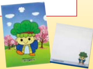
クリアファイル ふせん

☎市内在住・在勤・在学の方 ㊦2月10日(必着)までに、①クイズの答え②アンケートの回答③郵便番号・住所④氏名⑤年齢⑥電話番号を記入のうえ、市ホームページ内応募フォーム(2次元コードからアクセス)、窓口、郵送または電子メールで秘書広報課(☎hishokoho@city.yashio.lg.jp)へ ※応募は1人1通まで。 ※当選は、ハッピーこまちゃんクリアファイルとふせんのセットの発送をもって代えさせていただきます。