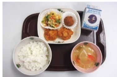
令和5年11月17日 地場産野菜入りみそ汁 ☎学務課☎☎865