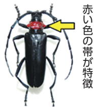
赤い色の帯が特徴

市では、薬剤を注入するなど防除に努めていますが、発見した場合はその場での捕殺にご協力ください。