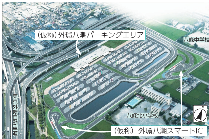
※現時点でのイメージであり、今後、変更となる可能性があります。