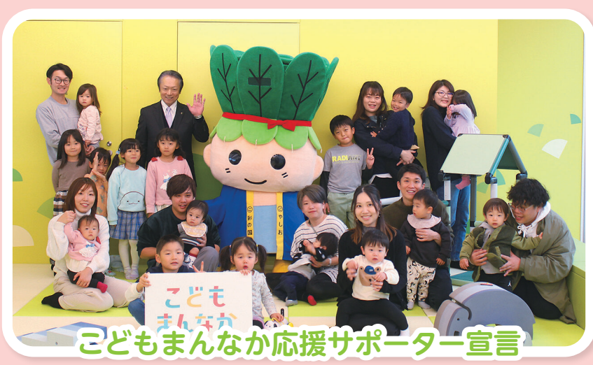
こどもまんなか応援サポーター宣言