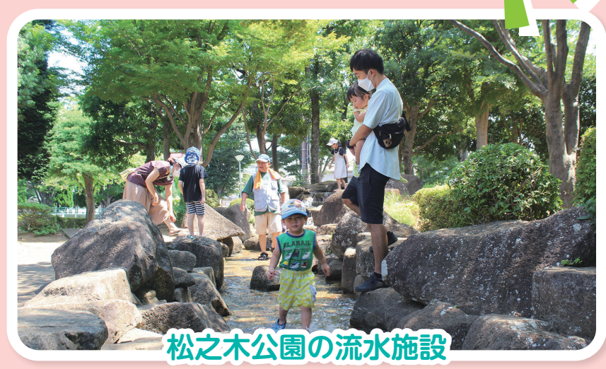
松之木公園の流水施設