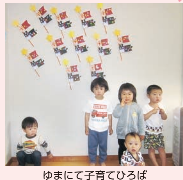
ゆまにて子育てひろば