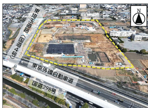
※パーキングエリア

現在、市には東京外環自動車道への出入口がありません。これらの施設が整備されることで、市内から同路線へのアクセス性の向上が期待できることから、早期開通に向け事業を推進します。