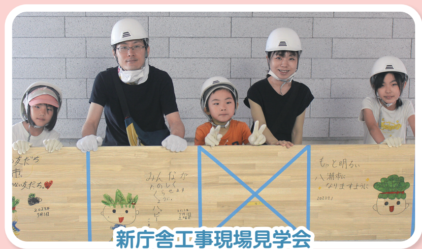
新庁舎工事現場見学会