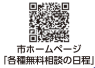
市ホームページ「各種無料相談の日程」

①法律相談 問秘書広報課 ☎9373 法律上の諸問題についての相談(弁護士が対応) ※2日前の水曜日(祝日の場合は翌日)午前9時から電話予約 日毎週金曜日 午後1時20分～4時 場市民相談室 定8人(電話による事前予約制)