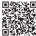
アルコールウォッチ (厚生労働省)

厚生労働省では、純アルコール量とアルコール分解時間を把握するためのWebツールを掲載しています。自分の健康を管理するための方法の1つとして、活用してみましょう。