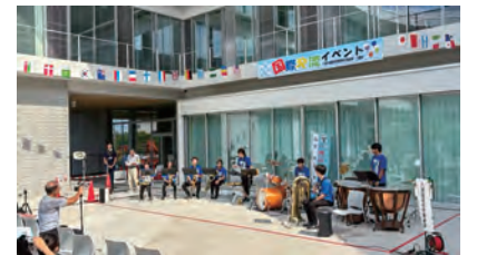
国際交流イベントの様子

任期 4月下旬～令和9年3月31日 対 国際交流事業に興味関心のある方※年齢、国籍は問いません。 内 秋ごろ開催予定の国際交流イベントの企画・運営(年5回程度) 申 3月27日(必着)までに、申込書(公共施設または市ホームページで入手)を窓口、郵送、ファクスまたは電子メールで、八潮市国際交流事業実行委員会事務局(市民協働推進課内☎328、✉shiminkyodo@city.yashio.lg.jp)へ