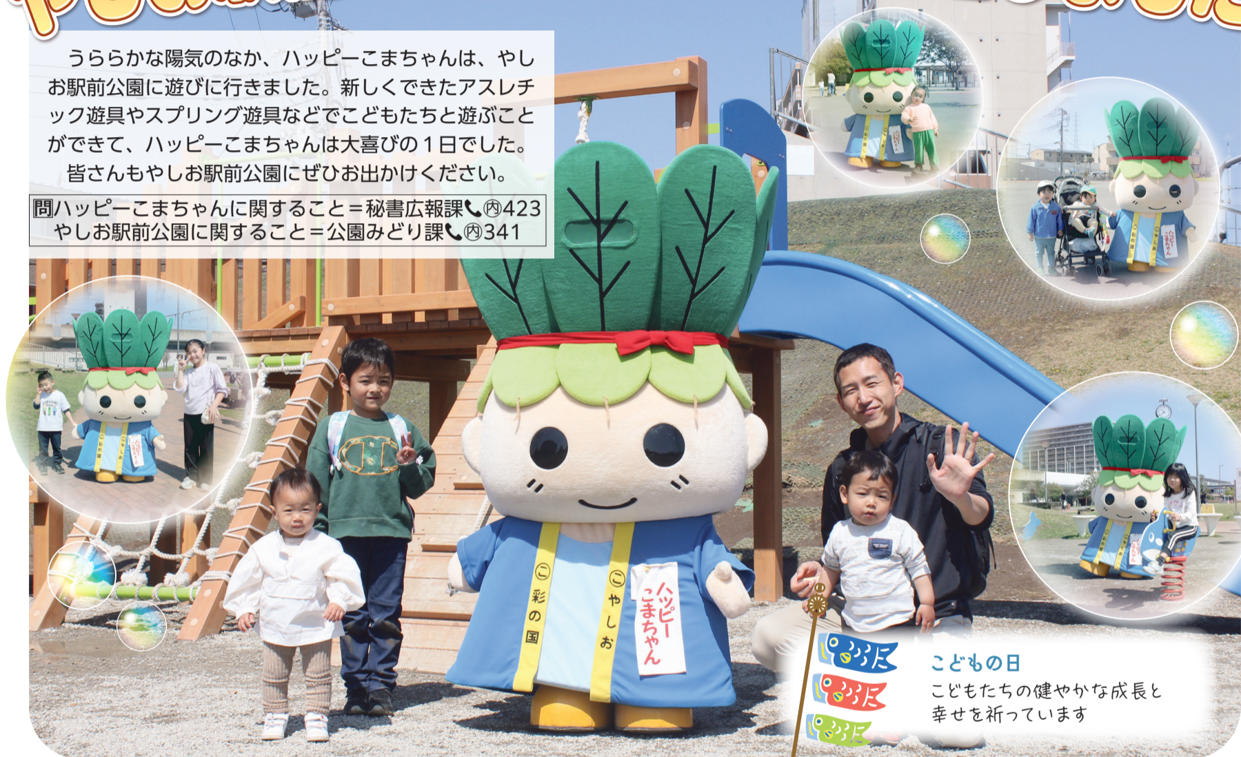
こどもの日 こどもたちの健やかな成長と 幸せを祈っています

問ハッピーこまちゃんに関すること=秘書広報課☎423 やしお駅前公園に関すること=公園みどり課☎341