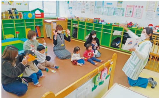
やわた子育てひろば