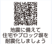
地震に備えて住宅やブロック塀を耐震化しましょう

詳しくは、パンフレット（住宅・建築課で入手）または市ホームページをご覧ください。