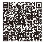
委託医療機関一覧