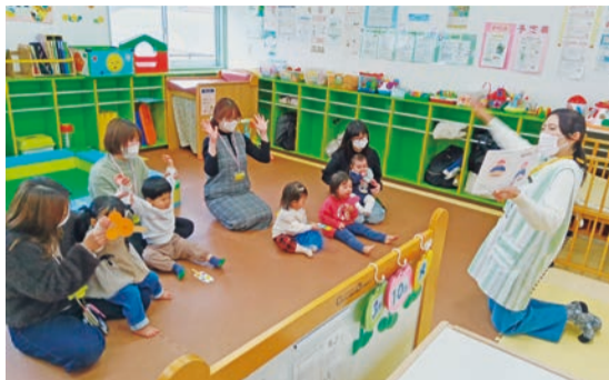
やわた子育てひろば