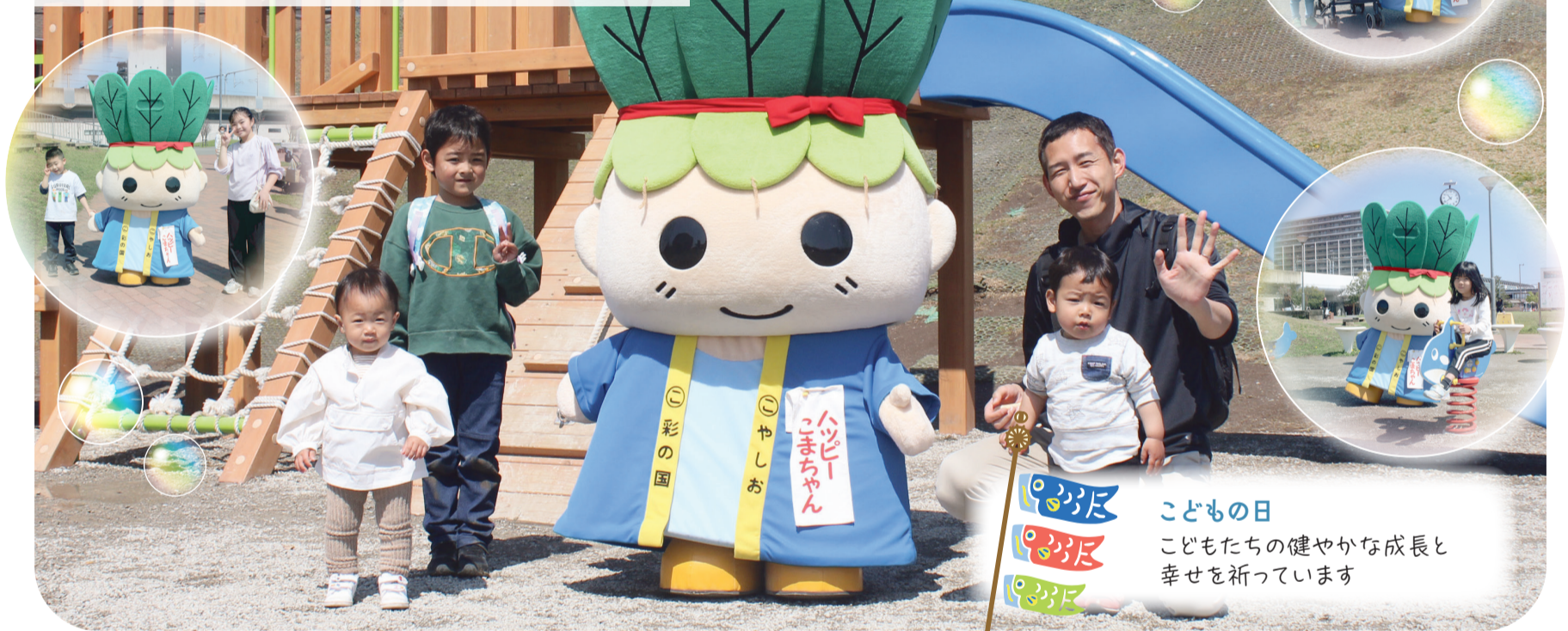
こどもの日 こどもたちの健やかな成長と 幸せを祈っています

問ハッピーこまちゃんに関すること=秘書広報課☎423 やしお駅前公園に関すること=公園みどり課☎341