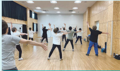
スリムシェイプエアロ