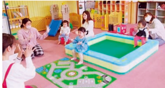
はちじょう子育てひろば