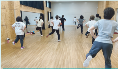
スリムシェイプエアロ