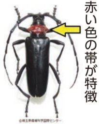
赤い色の帯が特徴

サクラを中心としたバラ科の樹木被害が確認されています。成虫は全体に光沢のある黒色で、首回りの赤色が特徴です。6月から8月上旬に現れ、樹皮の割れ目に産卵し、繁殖力が強いのが特徴です。市内では、過去3年間に160本の樹木が被害を受けています。