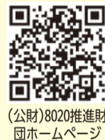
(公財)8020推進財団ホームページ

歯を失う主な原因は、歯周病とむし歯です。歯と口の健康を守るためには、毎日の歯みがきなど自分で行う「セルフケア」と歯科医院で受ける「プロフェッショナルケア」の両方を生活に取り入れることが重要です。この機会に、歯みがき習慣を見直し、「かかりつけ歯科医」を持ちましょう。歯と口の健康について詳しくは、(公財)8020推進財団ホームページをご覧ください。