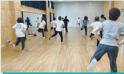
スリムシェイプエアロ