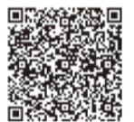
各種検診のご案内