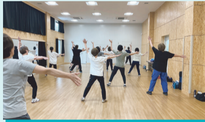
スリムシェイプエアロ