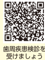
歯周疾患検診を受けましょう