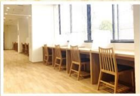
閲覧用カウンター席