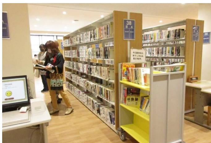
図書館：一般書コーナー