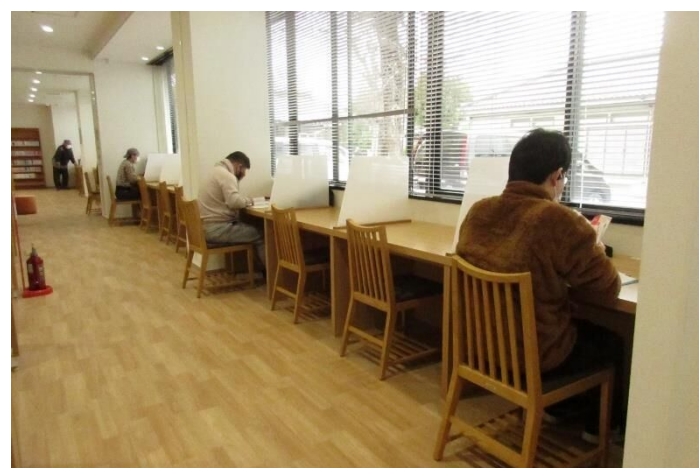
図書館：窓辺の閲覧席