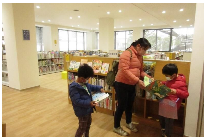
図書館：児童書コーナー