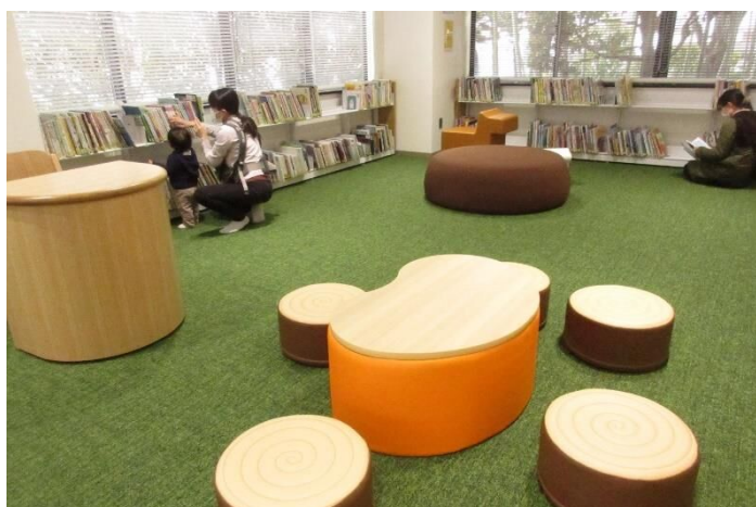
図書館：おはなしのへや