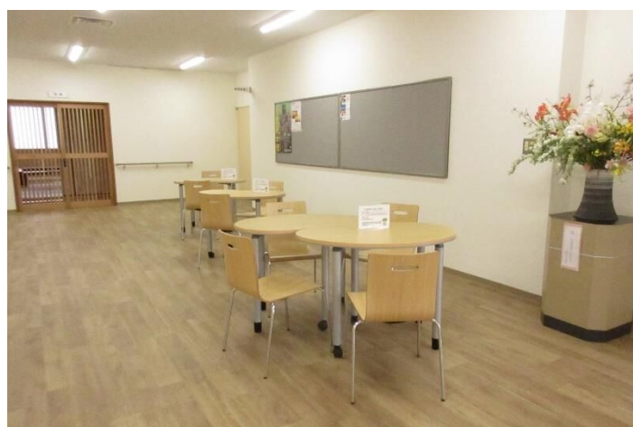
公民館：フリースペース