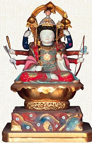
弁才天像・持昌院蔵