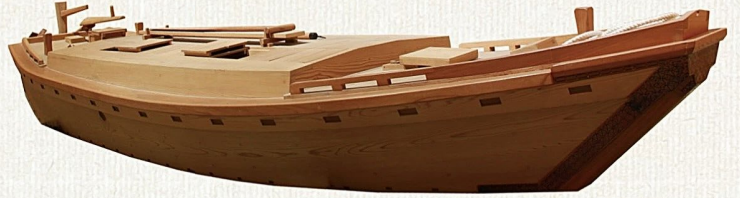
伝馬船（模型）・当館蔵