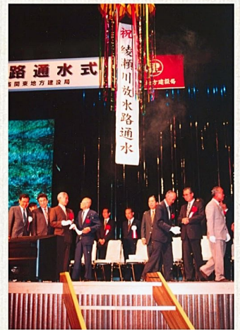
綾瀬川放水路通水式

八潮市域は中川や綾瀬川等の河川、葛西用水・八條用水といった用水が流れ、水と深い関わりをもって発展してきました。水は人びとの生活を豊かにすると同時に、水の被害で生活に支障をきたすこともありました。本企画展ではこのような水の多面的な部分に着目します。八潮市立資料館は開館当初より、「水と生活」をコンセプトに、多くの展示・研究成果を蓄積してきました。今回はその集大成として、「河川改修」「用水」「舟運」を大きなテーマに、八潮市域と水の歴史を紐解きます。