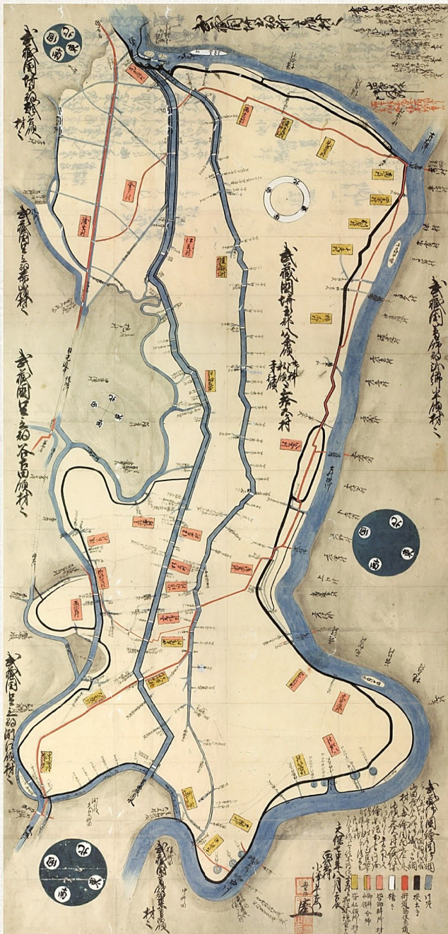
武蔵国八條領内絵図・個人蔵