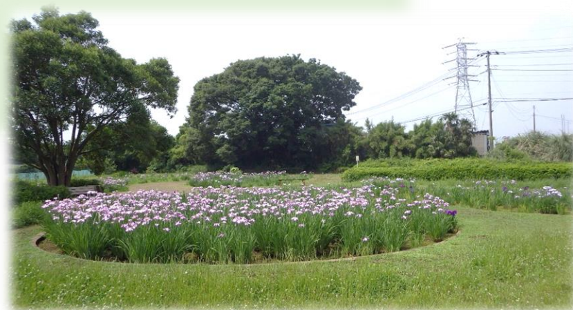
撮影場所：八潮南公園

ベンチ寄附事業は、「多くの方にベンチを通して公園へ愛着を持ってもらいたい」、「皆さんの想いをベンチにメッセージとして残してもらいたい」という願いを込めて実施する事業です。