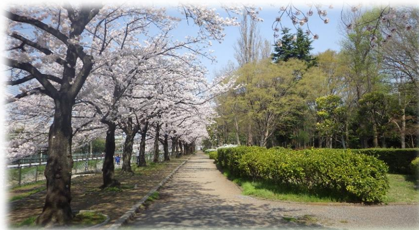
撮影場所：八条親水公園