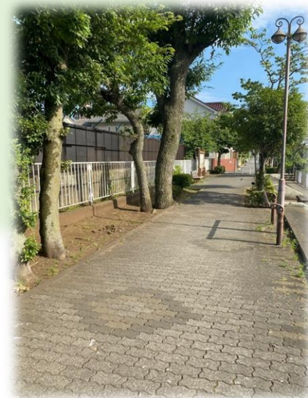
撮影場所：どんぐり遊歩道