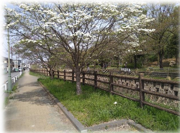
撮影場所：八条ふれあい緑道